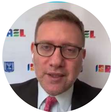
Excmo. Christian Cantor Embajador de Israel en Colombia.