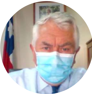
Dr. Enrique París Ministro de Salud de la República de Chile.

También, afirmó que, si bien el proceso ha sido exitoso en el país y esperan alcanzar en junio de 2021 un 80% de la población vacunada, es necesario continuar con las medidas de protección y prevención de contagios, como son el uso de mascarillas y el distanciamiento social, entre otros.